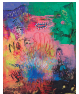
《WORK #2486》2024年 ミクストメディア/キャンパス