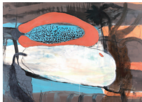
《WORK #2189》2022年 アクリル絵具/キャンパス