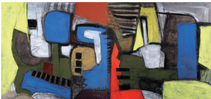
《WORK #1957・#1958》2018年 油彩、アクリル絵具、木炭/キャンパス

はつかいち美術ギャラリーではこのたび、世界で活躍し、65年以上のキャリアを誇るコシノヒロコの展覧会「コシノヒロコ展 COLORS 88 — アートとファッションの世界 —」を開催します。コシノは近年ファッションデザイナーとしての枠を超え、生涯を通じて取り組んでいるアートの制作においても大きくその活動の場を広げ、高い評価を得ています。本展では「COLORS 88」をテーマに、約100点のアートとファッションの彩り鮮やかな世界をご覧いただけます。絵画の部屋では、創作の原点として描き続けてきた色彩豊かな絵画を発表、そしてファッションの部屋ではヒロココシノコレクションで発表した洋服作品をダイナミックに展開します。2025年に88歳を迎えるコシノ。今もなお、暮らしの中の真の豊かさを求めて、アートとものづくりを未来に継承する活動を続けるコシノヒロコの世界をお楽しみください。