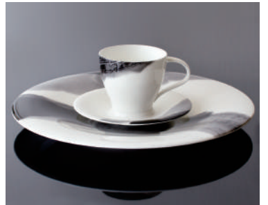
《墨の瞬シリーズ》 フラインボーンチャイナ/ニッコー株式会社