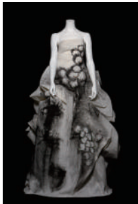
《'11 春夏コレクション》