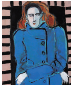
《WORK #2281》2021年 油彩、アクリル絵具/キャンパス