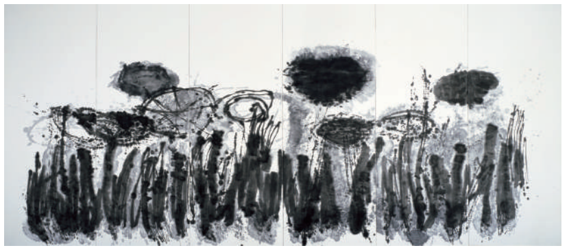
《WORK #377》2005年 墨/和紙