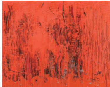
《WORK #757》2011年 墨、アクリル絵具/和紙